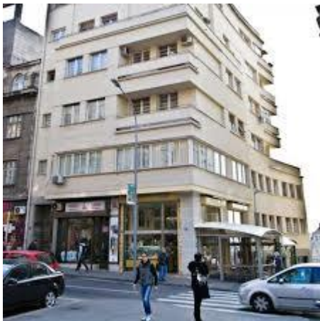
Tabla na ulazu u zgradu podseća nas da je u ovoj zgradi Ivo Andrić napisao „Na Drini ćupriju”, „Travničku hroniku”, „Prokletu avliju”. Dela za koja je dobio Nobelovu nagradu (1961.g). («Pa posle kažu da je feng šui nebitna stvar! U nagrađenoj zgradi pišu se knjige za nagradu!»)

Ovo je zgrada koja je dobila nagradu za najlpsu fasadu Beograda 1934.godine- ( arhitekti Branislavu Kojiću ). Arhitektonska vrednost Prizrenske 7 je stilska vežba bez kompromisa. Bočan zid prema strmoj Reljinoj ulici je zakrivljen, kao supermenov šlep i čini se da cela zgrada uzleće uz padinu. Otvorene terase prema Savi poštuju pogled koji „puca“ s Terazijaskog parka. Balkoni seku vertikalnu i dupliranjem po horizontali dinamizuju fasadu. Kojić se igrao geometrijom, ali je igru iskusno podredio nagibu terena i osunčanosti stanova.